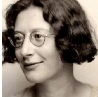
Simone Weil (1909-1943)

“On pense aujourd’hui à la révolution, non comme à une solution des problèmes posés par l’actualité, mais comme à un miracle dispensant de résoudre les problèmes.”